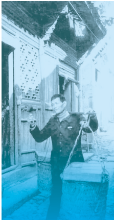
▲拨浪鼓、扁担和两头的货筐，曾是义乌人“鸡毛换糖”的标配。

从2006年到2026年，“义乌发展经验”走过20年，成为因地制宜发展县域经济的成功实践。我们从4个有趣的视角重新读懂这座“开挂”小城。