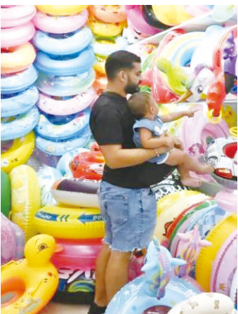
▲外商带小朋友采购游泳圈。

针对四足机器人、无人机等高端智造产品，市场还专门优化了展示环境，实现了从“摆不下”到“秀得开”的突破。