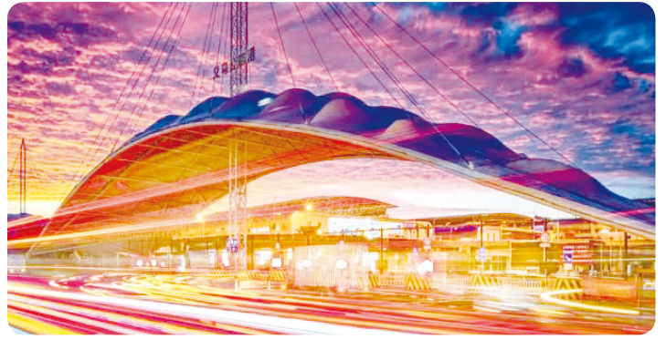
▲繁忙的义乌公路港。