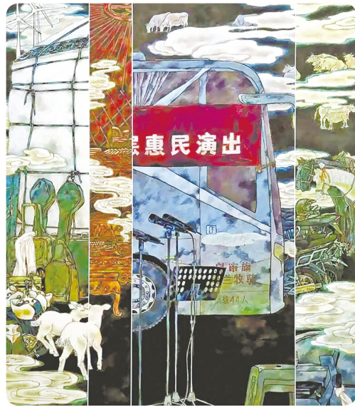
▲《乌兰牧骑到嘎查》 (要红霞)