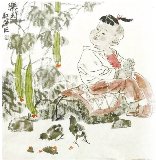
▲《乡童系列·乐园》 (要红宇)