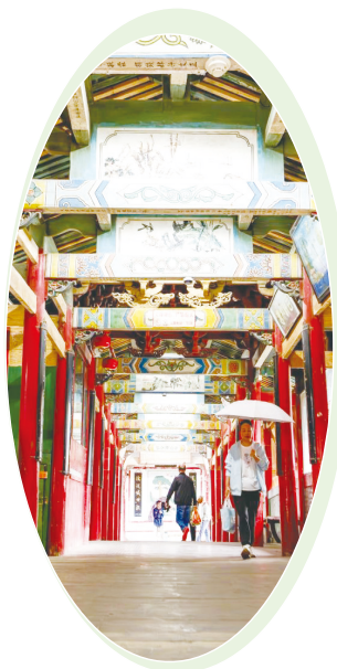
▲全国重点文物保护单位仙宫桥内景。仙宫桥位于宁德市寿宁县，始建于明代。