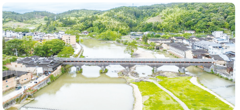
▲万安桥（无人机照片）。万安桥地处宁德市屏南县，始建于北宋，为全国重点文物保护单位。