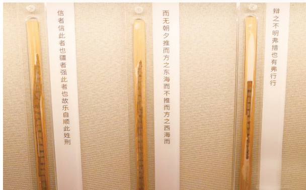
▲4月14日,南昌汉代海昏侯国遗址博物馆内展出的《礼记·祭义》简牍。

“孔子智道之易也，易易云者三日。子曰，此道之美也，莫之御也。”在南昌汉代海昏侯国遗址博物馆内，曾经失传1800余年的齐《论语·智道》竹简上，那些千余年前的清晰墨迹无声地向今人讲述着汉代的书香故事。