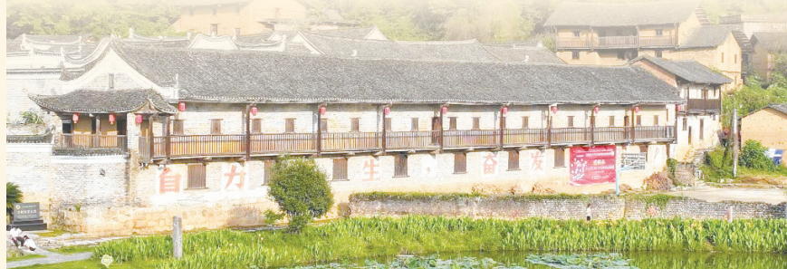
▲宝镜古民居走马吊楼(又称“长工楼”)