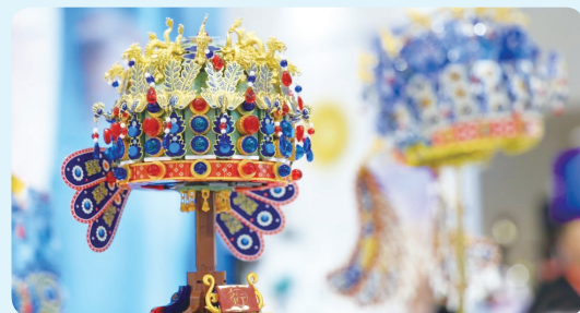
▲在文博会上拍摄的明孝端皇后凤冠文创拼装模型（5月22日/摄）。