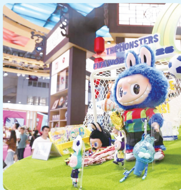
▲观众在文博会北京展区观看泡泡玛特 THE MONSTERS 与 FIFA 世界杯联名潮玩（5月24日摄）。