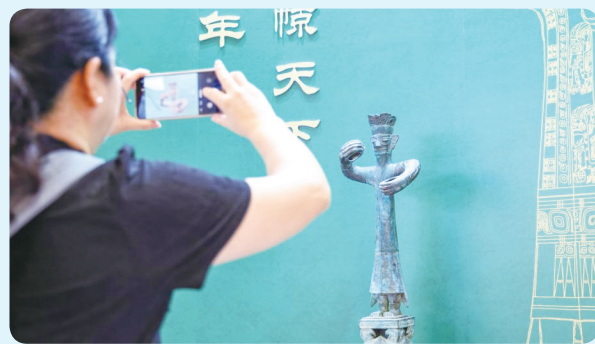
▲观众在文博会三星堆博物馆展台拍摄展品（5月22日摄）。

第二十二届中国（深圳）国际文化产业博览交易会（以下简称“文博会”）5月21—25日在深圳举行，本届文博会共展出各类文化精品超12万件，其中，“文创中国”展区集聚当前国内优质头部文化IP、科创潮品、文旅精品、非遗好物与热门文创，博物馆文创展区汇聚30多家国内知名文博场馆及特色博物馆，丰富的文创精品吸引众多观众。