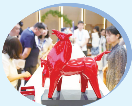
▲观众在文博会上选购文创产品（5月22日摄）。

第二十二届中国（深圳）国际文化产业博览交易会（以下简称“文博会”）5月21—25日在深圳举行，本届文博会共展出各类文化精品超12万件，其中，“文创中国”展区集聚当前国内优质头部文化IP、科创潮品、文旅精品、非遗好物与热门文创，博物馆文创展区汇聚30多家国内知名文博场馆及特色博物馆，丰富的文创精品吸引众多观众。