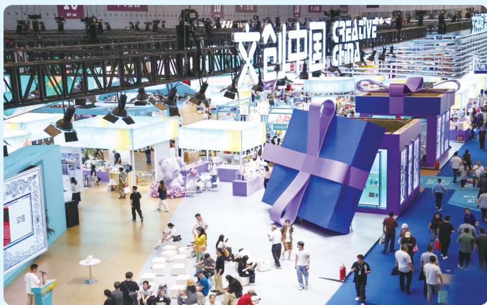
▲文博会“文创中国”展区（5月22日摄）。