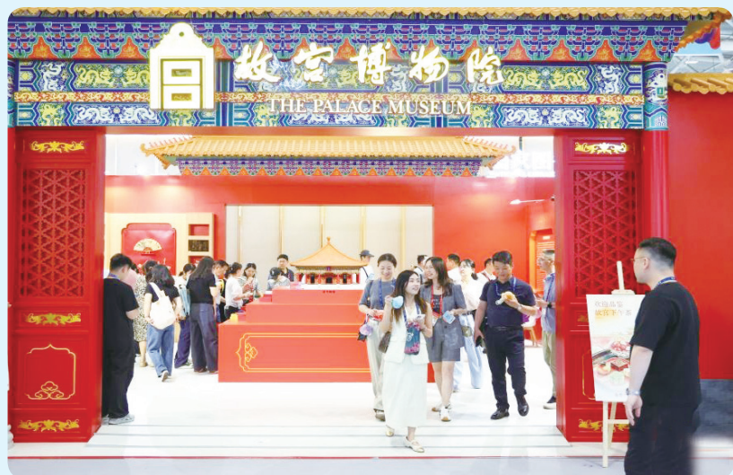
▲观众在文博会故宫博物院展台参观（5月22日摄）。