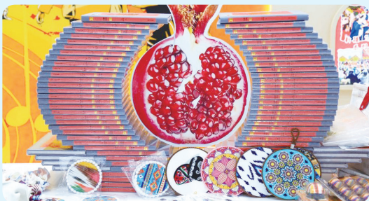
▲在文博会新疆馆拍摄的书籍和文创产品（5月22日/摄）。