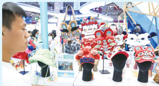
▲观众在文博会广西馆了解虎头包等文创产品（5月22日/摄）。