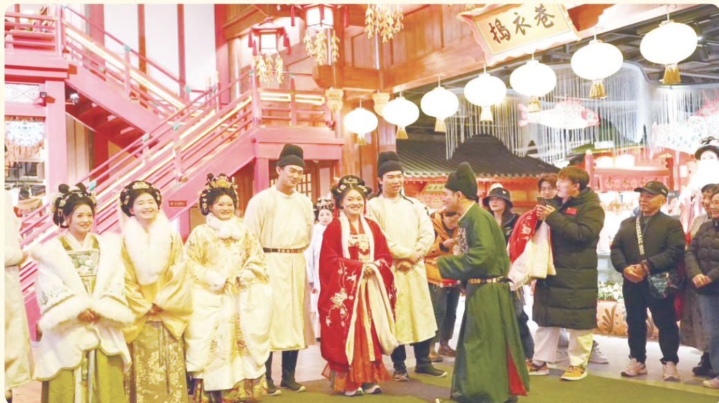
▲在西安长安十二时辰街区，游客与工作人员扮演的角色进行对诗游戏。