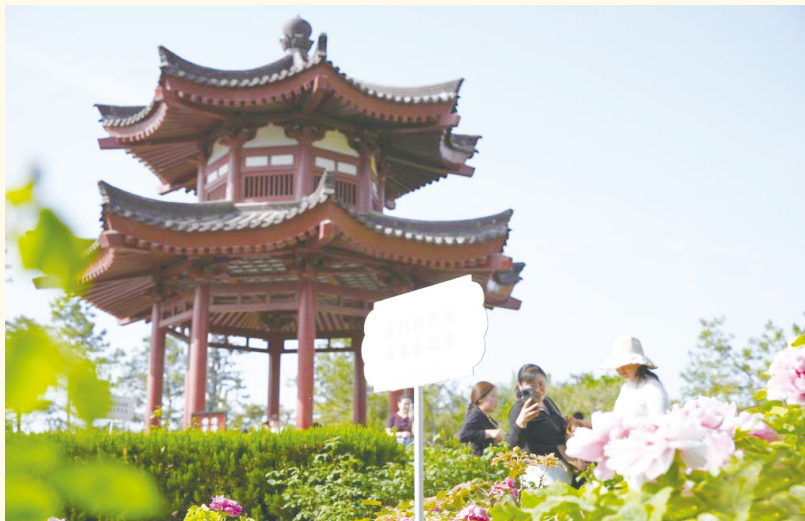
▲游人在西安大慈恩寺牡丹园游览。