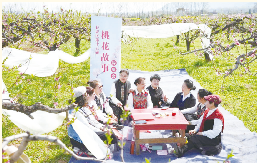
▲诗歌爱好者在西安市长安区王莽街道土门峪村桃花园内朗诵唐诗。