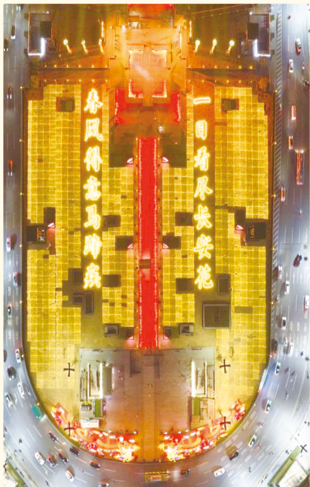
▲这是西安城墙永宁门南广场“春风得意马蹄疾，一日看尽长安花”诗句造型的花灯（无人机照片）。