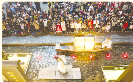
▲游客在西安大唐不夜城街区观看以诗人李白为原型创作的情景剧。