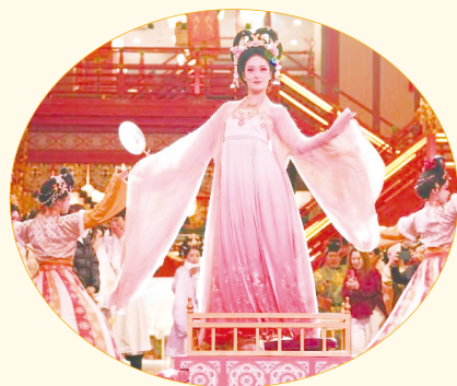
▲在西安长安十二时辰街区，演员以唐诗中的杨贵妃为主题进行沉浸式表演。