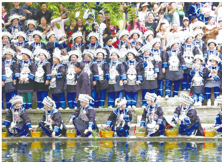
侗族群众在贵州省镇远县报京侗寨参加“三月三”讨葱定情活动。

4月18—21日，第四十一届报京“三月三”民俗文化节活动在贵州省镇远县报京侗寨举行，通过非遗巡游、讨葱定情、侗歌对唱等民俗活动，欢度“三月三”。报京“三月三”是当地侗族传统节日，又名“播种节”，俗称“讨葱节”。