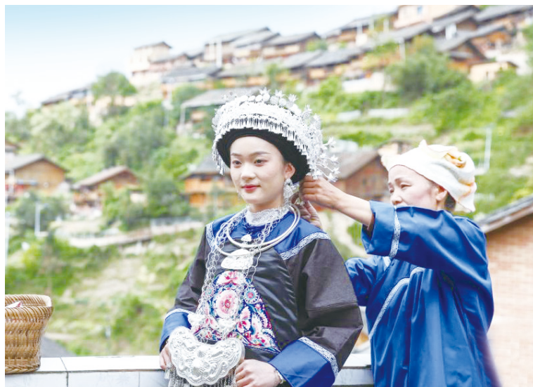
在贵州省镇远县报京侗寨，参加“三月三”民俗活动的侗族群众在整理节日服装。