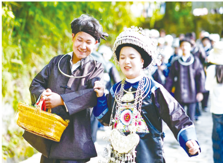
侗族青年在贵州省镇远县报京侗寨参加“三月三”讨葱定情活动。