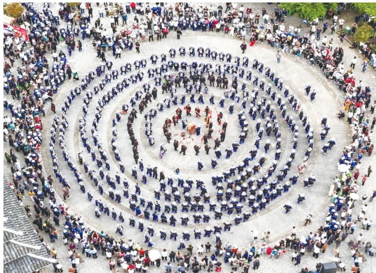
人们在贵州省镇远县报京侗寨“三月三”民俗活动中跳团圆舞。