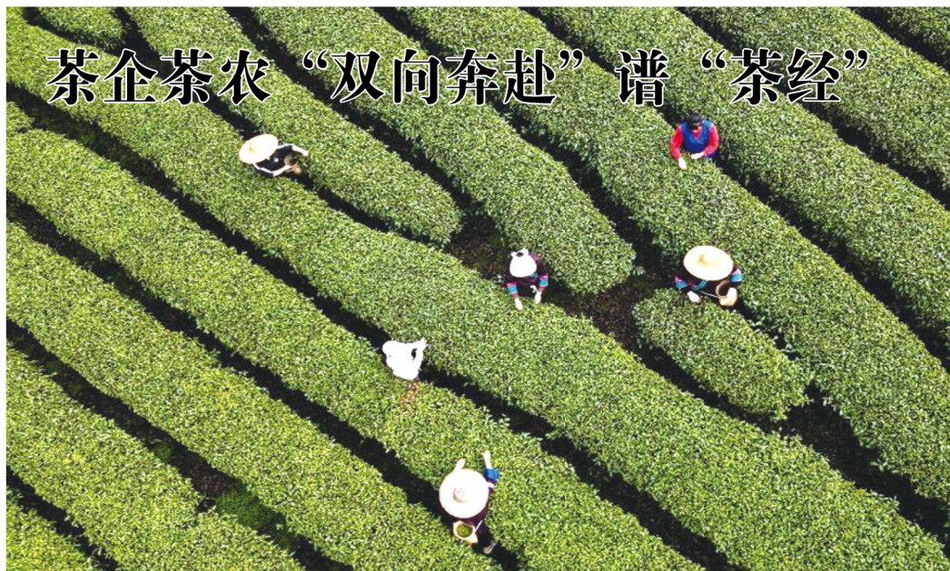
春节过后，广西三江侗族自治县近500家茶企、专业合作社、家庭农场，带动30多万涉茶群众，抢抓春茶黄金季，全力推动茶叶精深加工生产。三江侗族自治县现有茶叶种植面积21.5万亩，干茶年产量超2万吨，年综合产值87亿元。