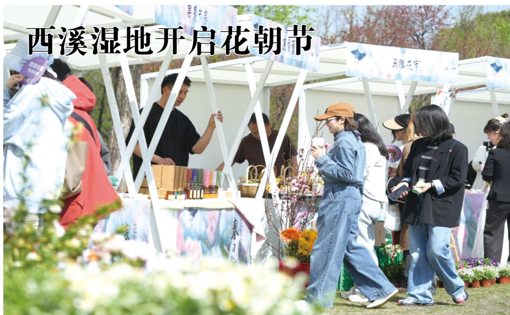
3月24日，浙江省杭州市西溪湿地开启一年一度的花朝节，在传统节日中营造美丽经济。