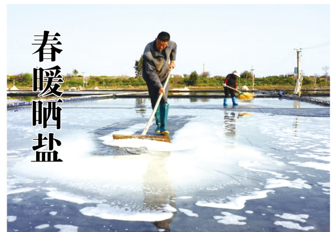
春日气温回升，正是采用日晒、调卤、结晶等古法晒盐的好时节。在浙江省乐清市南塘镇山马晒盐场，工作人员趁着晴好天气忙着晒盐收盐。