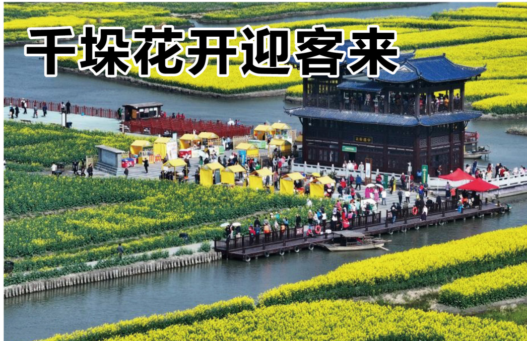
随着气温回升，江苏省兴化市千垛景区的油菜花陆续开放。金黄色的油菜花与纵横交错的河道交相辉映，构成“河有万湾多碧水，田无一垛不黄花”的春日画卷，吸引了不少游客前来赏花，尽享美好春光。