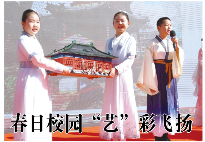
日前，北京市东城区府学胡同小学举行主题为“春日拾光，温暖学府”的书画摄影展活动。学生们以笔为羽，以墨为翼，在展现艺术才华的同时，感悟春日色彩与生机。