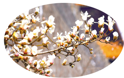
近日，北京故宫东华门的玉兰花迎春绽放，红墙青砖与洁白如玉的玉兰花相互映衬，构成了一幅雅致有趣的画面。