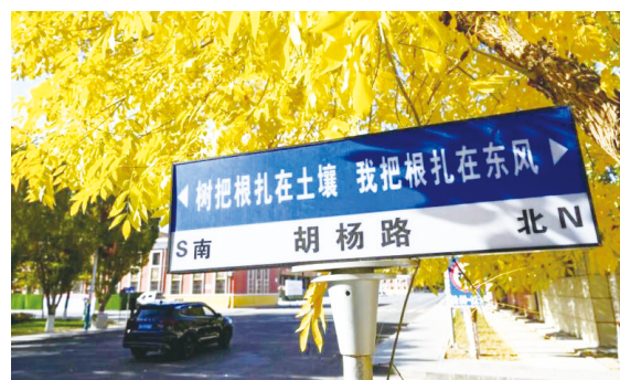
▲东风航天城内的路牌。

阿拉善人民与祖国一道见证了中华民族“摘星揽月上九天”的梦想一步步变为现实，“特别能吃苦、特别能战斗、特别能攻关、特别能奉献”的载人航天精神，在阿拉善盟各族干部群众中得到传承和发扬，这份自豪与荣耀，已成为专属阿拉善的航天印记。